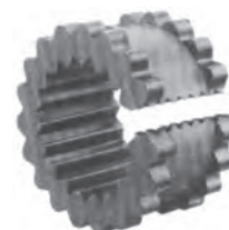
JEMS - JNS