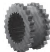
JEM - JN