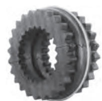
EM - E - N