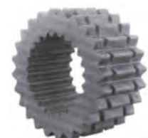
H - HS